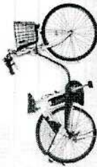
シェアサイクル用の電動アシスト自転車